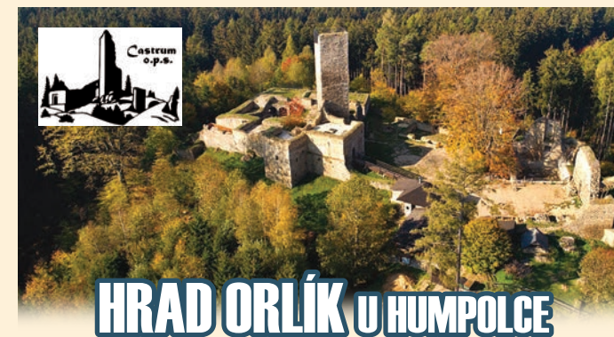
HRAD ORLÍK U HUMPOLCE

Hrad vznikl nad středověkými zlatými doly dodnes patrnými a sloužil svým majitelům až do konce třicetileté války. Po jejím konci již všichni toužili po něčem jiném než po bezpečí starého hradu. Pokusy o konzervaci již jeho zříceniny přicházejí před velkou válkou, avšak rozsáhlých vykopávek a konzervace se dočkal až počátkem té druhé světové. Současné dobrovolnické aktivity sahají před rok 1989.