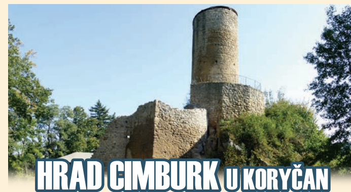
HRAD CIMBURK U KORYČAN