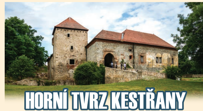
HORNÍ TVRZ KESTŘANY

Unikátně dochovaná raně – pozdně gotická tvrz postavená jako součást manské soustavy královského hradu v Písku. Objekt je přístupný po celý rok. Návštěvníci si mohou prohlédnout tvrz, gotické sklepení, přilehlý park a vinice, které jsou připomínkou tradice pěstování vína v Kestřanech.